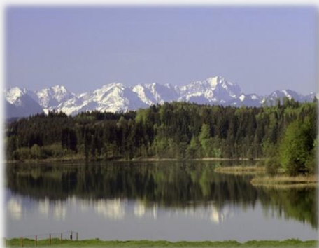
Penzberg: beste Lage südlich von München