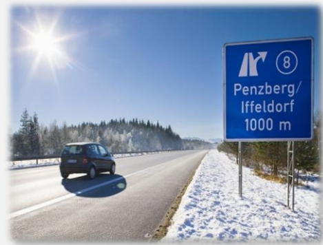
Optimale Anbindung direkt über die Autobahn 95