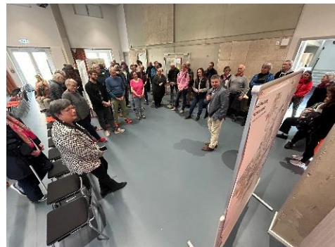
Tag der Städtebauförderung

Hier finden Sie Medienberichte zum Tag der Städtebauförderung: