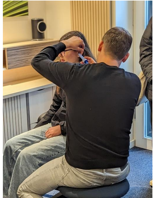
Anpassung eines Hörgeräts bei der Fa. Seiffert.

Am Nachmittag boten diverse Mitmachaktionen in der Mittelschule handfeste Herausforderungen. So konnten SchülerInnen sich unter anderem beim Fliesen legen ausprobieren oder bekamen eine Vorstellung davon, wie man beim Landschaftsgestalten Natursteine am besten in Szene setzt.