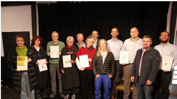
Urkundenverleihung zum Klimaschutz-Aktionsplan

Bekennen auch Sie sich zum städtischen Klimaschutz-Aktionsplan.